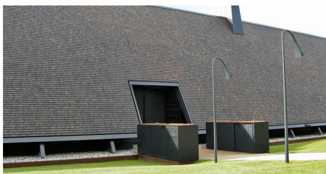
Forpatineret akacie efterbehandlet med TD-transparent.