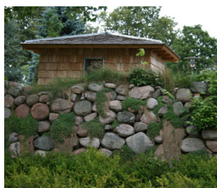
Tagspån ubehandlet Akacie.