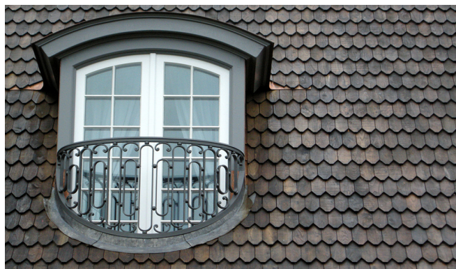
Tag og facade i Akaciespån, forpatineret med TD-Antik.

Firmaet rådgiver gerne om anvendelse, lægning og behandling af spåntage samt -facader. Tilbudsgivning baseret på specialuddannede faglærte sjak, autoriseret af Starup Øko-Træ. Referencer oplyses gerne.