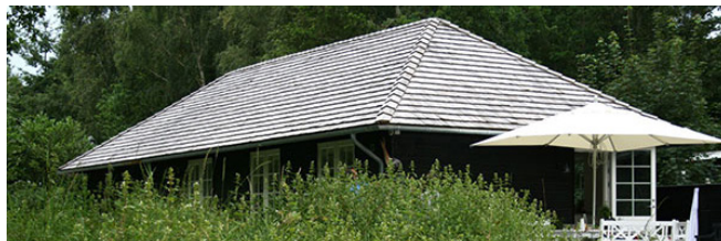
Tagspån i ubehandlet akacie.