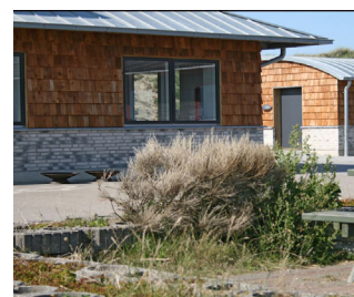
Tagspån ubehandlet Akacie og profileret facadebeklædning